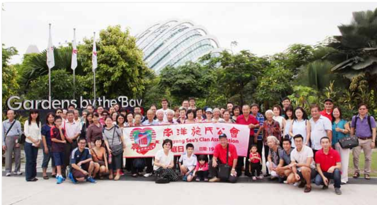
会员及家属们在滨海湾花园门口集体合影