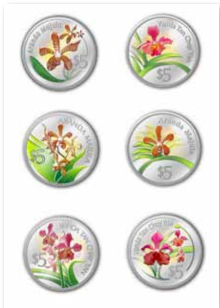
施学艺设计的胡姬花主题纪念币 一套2合1共用纪念钞票