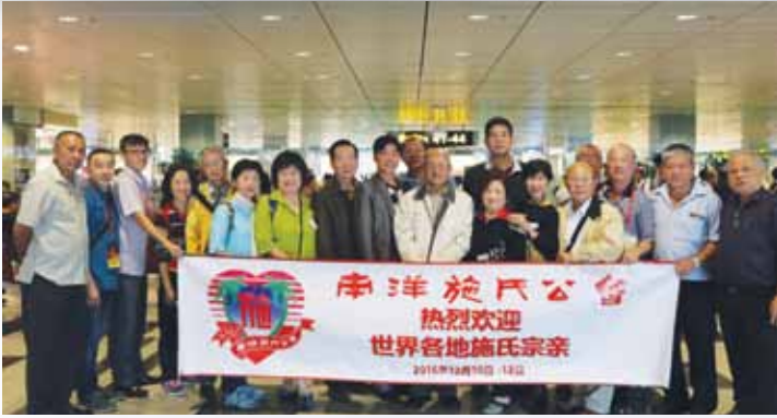
台湾施氏宗亲庆贺团