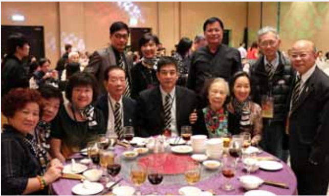
台湾施氏宗亲与剑徽姑合影