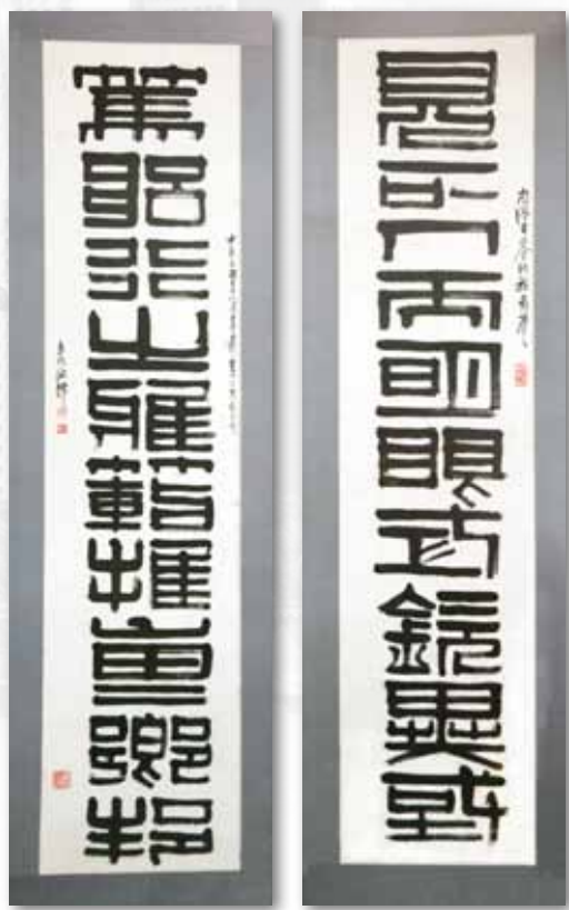
悬挂于本会所，施香沱题写的对联 “见正人而明眼式钦异国 笃躬行之雅范推重乡邦”

施香沱是新加坡、马来西亚影响最为深远的一位金石书画家。他一生献身于新加坡的美术教育及艺术推广，前后达半个世纪，桃李春风，江湖夜雨，为新马两国播下了艺术的种子，培养了众多水墨画、书法及篆刻英才，被誉为新加坡优秀的美术教育家。现在新马两地有所谓“施香沱派”即源于此。“施香沱派”人数众多，他们担任南洋美专教师，活跃于新马书坛，继承了施香沱老师在传播书法艺术、书