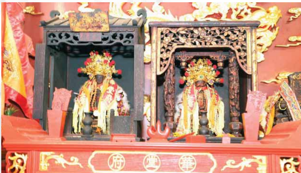
聚圣庙华堂府内施府王爷神尊（左边为副金身，右边为正金身）

神诞这一天，施姓全族宗亲齐集庆宴也是族群大团圆的日子。彼此间如有商议大件事，都在祖叔公神前擲