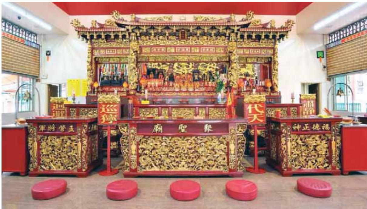
庄严华丽的聚圣庙内堂