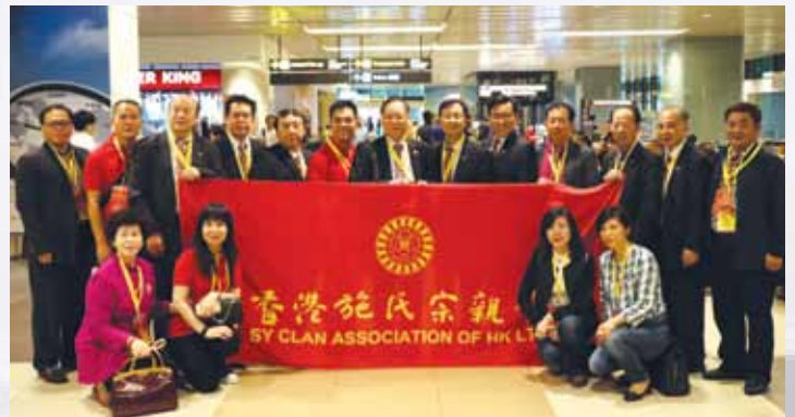
香港施氏宗亲会庆贺团