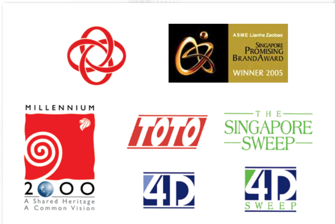
施学艺设计的标志作品