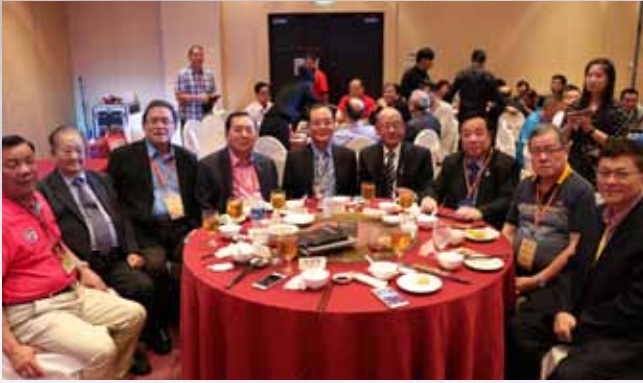
世界临濮施氏宗亲总会名誉理事长及正副理事长合影