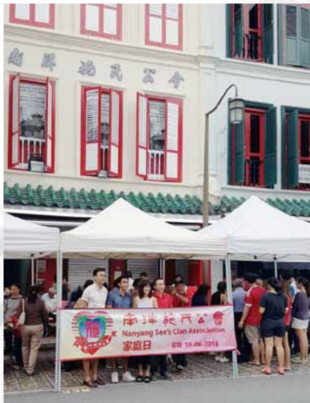
宗亲共聚品尝美味榴莲的热闹场面

继2015年本会主办的柔佛一日游活动受到众多会员的热捧后，为了再次将各位会员及家属们团聚在一起，增加情感，收获欢乐，本会在2016年6月19日举办家庭日，活动项目包括滨海湾花园两个冷室主题公园（Flower Dome 及 Cloud Forest）游览赏花，及设于本会门口的丰盛榴莲大餐。当天，虽然天气炎热，但却抵挡不住会员及其家属们参加家庭日的热情，共有70余位会员及其家属参与，场面热闹非凡，欢声笑语不断。