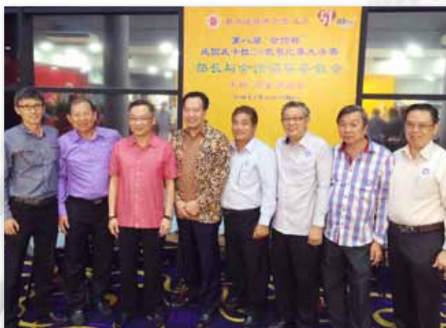
与新加坡卫生部长颜金勇（左三）合影