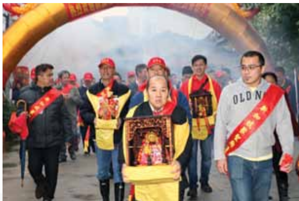
新加坡聚圣庙进香团 (前排首尊为华堂府施府王爷百年金身)

初期南下新加坡的安溪围内施氏族人有着相同的信仰，不时聚集在华堂府。随着时间的演变，华堂府逐步成为新加坡各施氏族人聚会交流的地