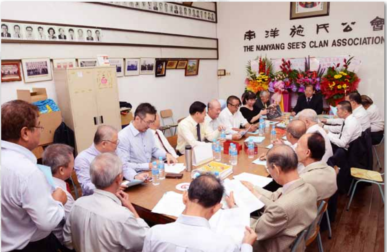
第54届执委会第一次会议