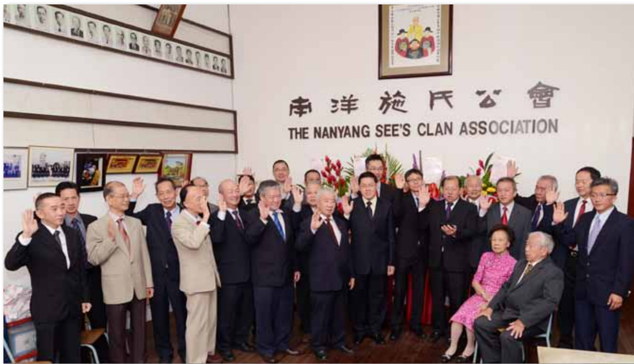
第54届执委会执委宣誓