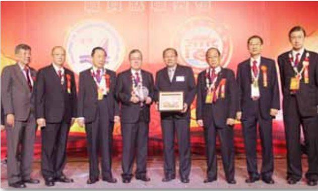
菲律宾晋江同乡总会暨菲律宾晋江商会职员就职典礼