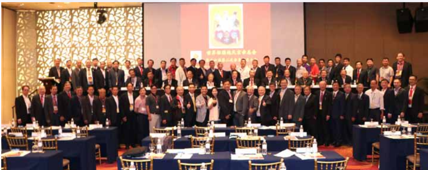
世界临濮施氏宗亲总会第16届第二次会员代表大会