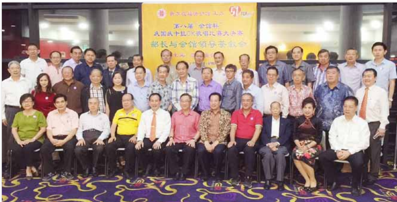
第八届“会馆杯”庆国庆卡拉OK歌唱比赛大决赛部长与会馆领导茶叙会合影