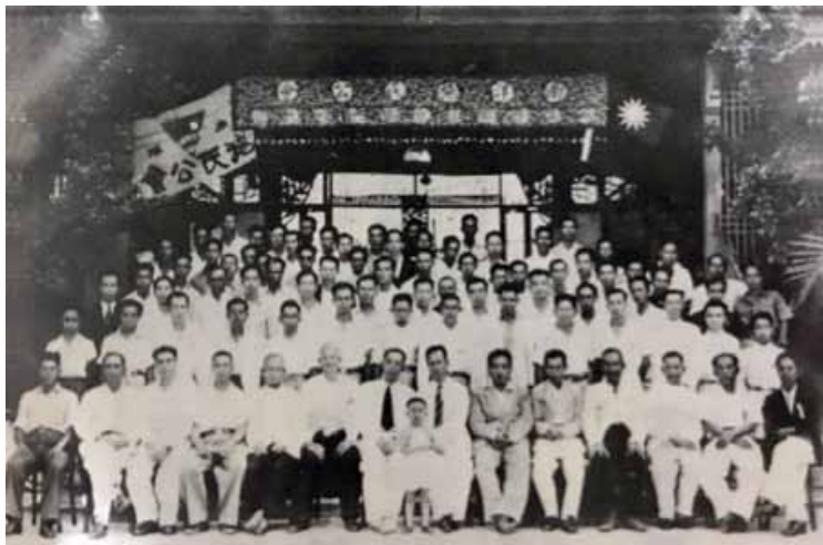
南洋施氏公会于1947年成立时，第一届职员与全体会员合影

在清末民初年间，我施氏宗亲在新加坡谋生的不多，而他们都是单身汉，便租赁小坡峇厘巷一屋为估俚间，称“泉和合公约所”，即为本会的前身。