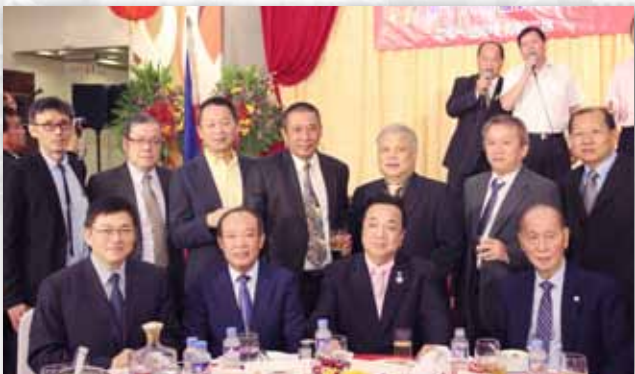
与世界临濮施氏宗亲总会历届理事长们合影