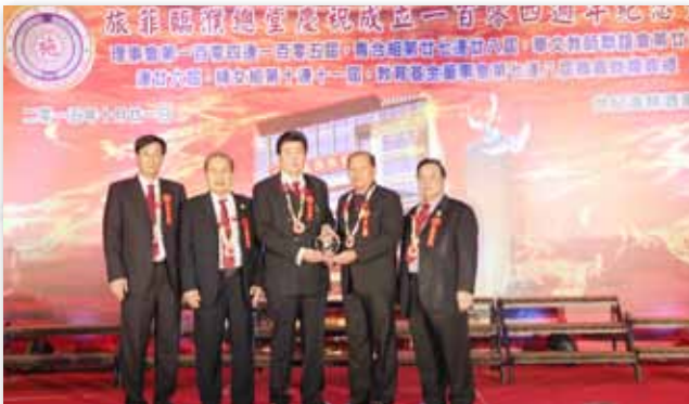
与菲律宾临濮总堂互赠纪念品