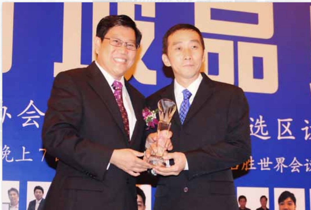
荣获2011年新加坡品牌奖

TRADING 走上品牌的道路，立足于维护和巩固自己的品牌地位，立足于消费者而不是立足于企业自身来树立品牌形象。不仅拥有自己的品牌产品，还拥有一支技术精湛的施工团队，并成功地把