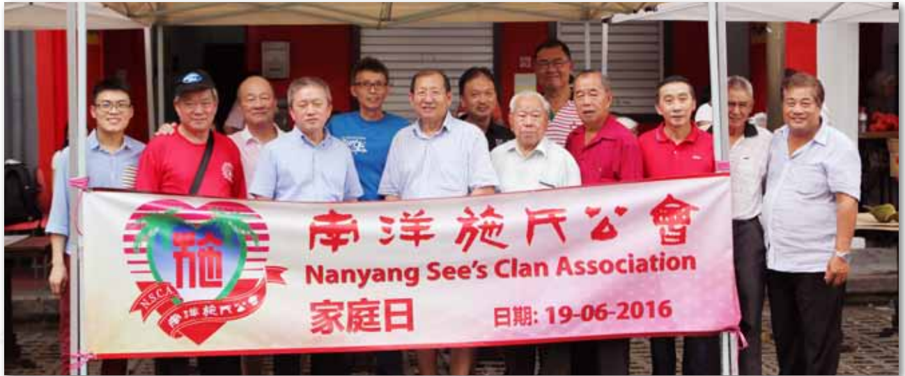
各位施先生一起合影