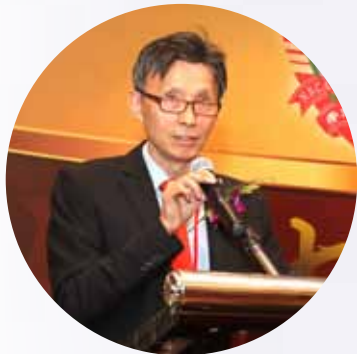
总务施能辉宗长致谢词