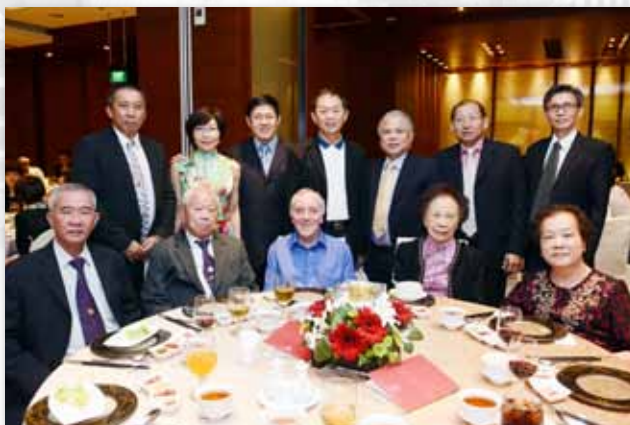
有朋自远方来，不亦乐乎