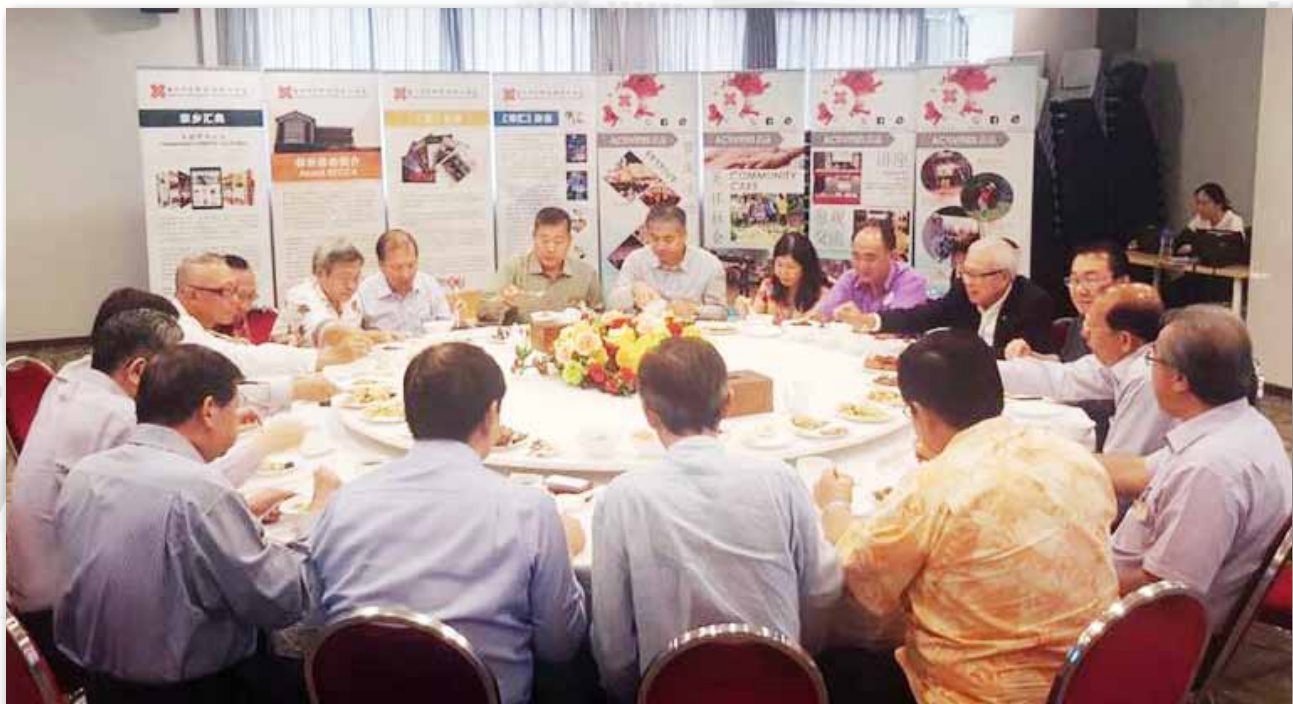
众会馆领导吃粥、交流看法