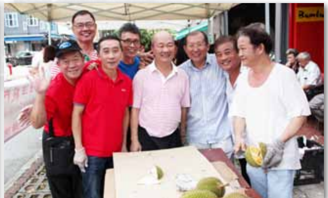
打开榴莲壳的那一刻，香气四溢，会员们聚在榴莲摊前