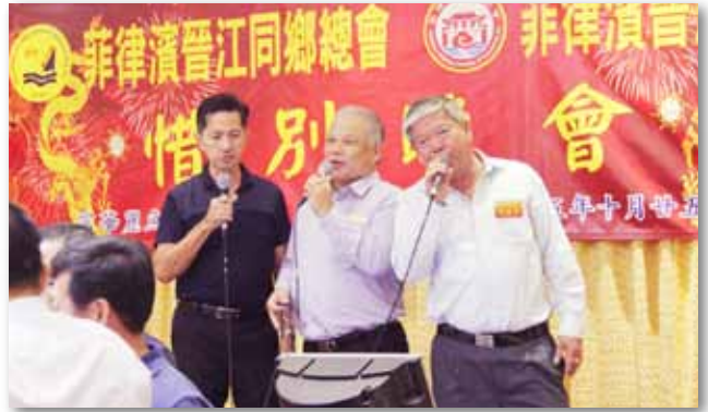
菲律宾晋江同乡总会暨菲律宾晋江商会惜别晚会