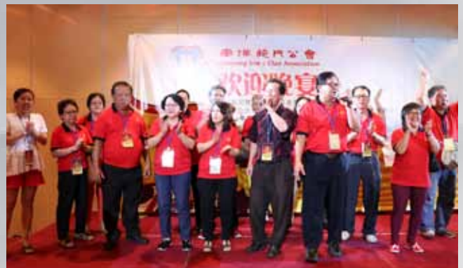
马来西亚吉坡施氏宗亲合唱