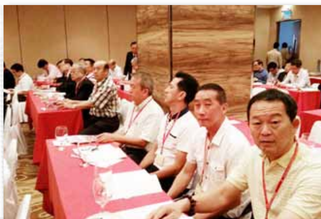
参加世界临濮施氏宗亲总会第16届会员代表大会一瞥