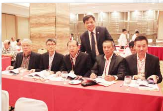
参加世界临濮施氏宗亲总会第16届会员代表大会合影