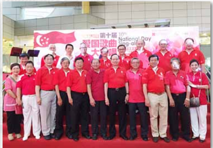
各团体主要领导大合照