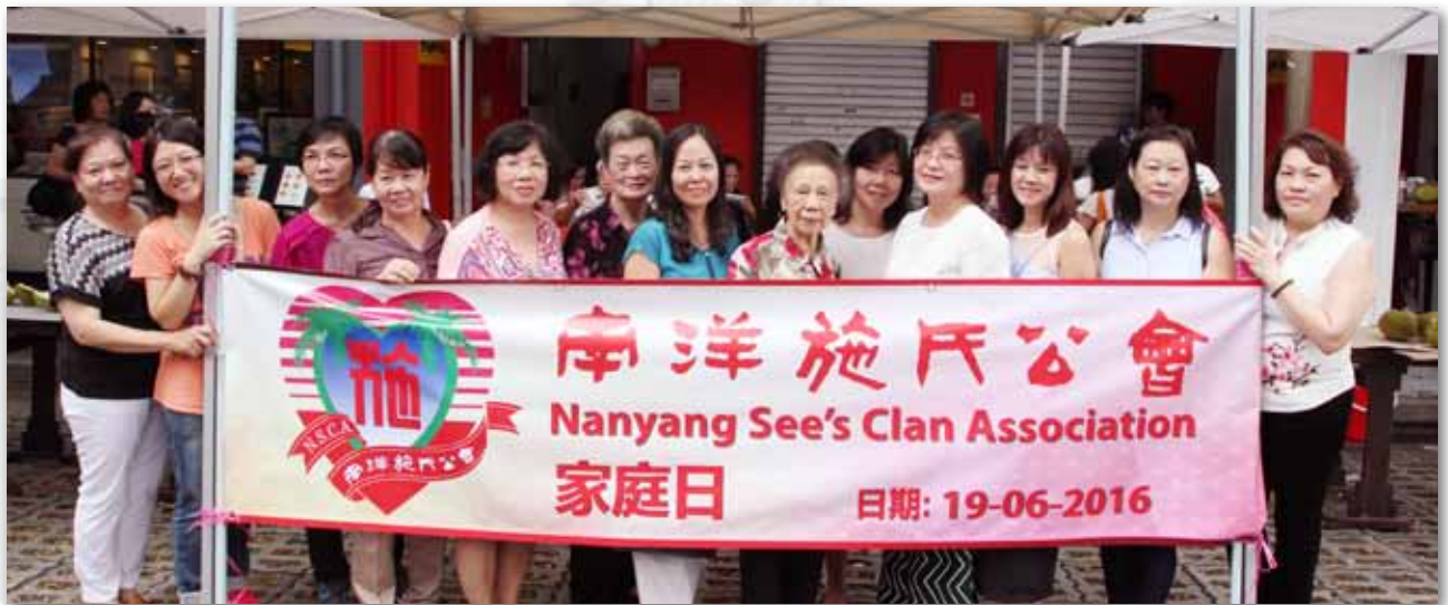
各位施太太与剑徽宗姑一起合影