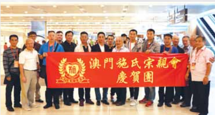
澳门施氏宗亲会庆贺团