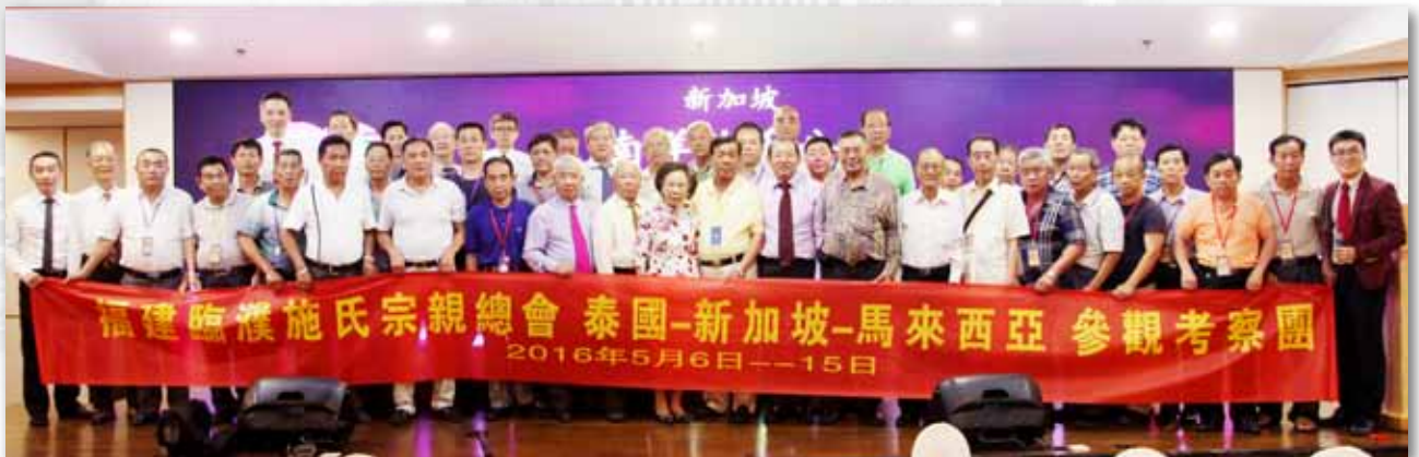
福建临濮施氏宗亲总会主要成员与本会执委合影