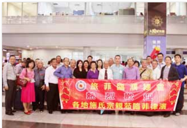
到达马尼拉国际机场，受热情迎接