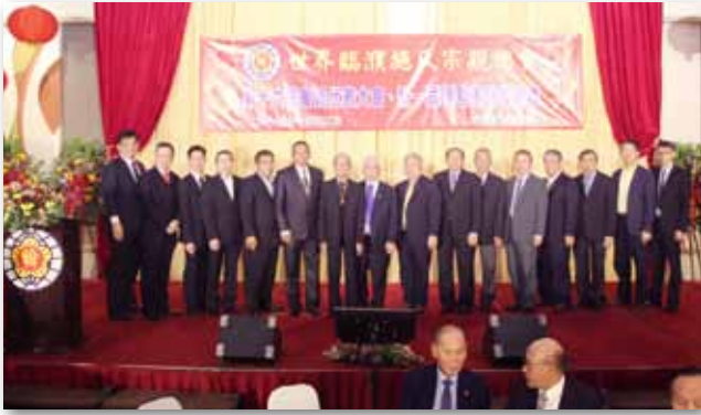
参加世界临濮施氏宗亲总会第16届理监事就职典礼集体照