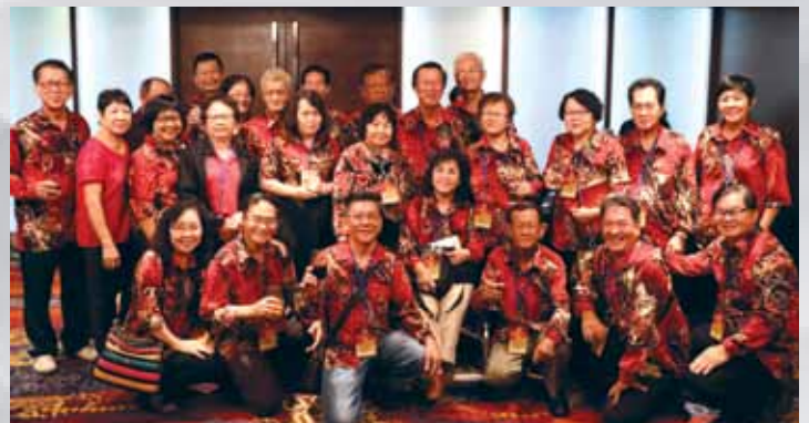
马来西亚吉坡施氏宗亲会庆贺团