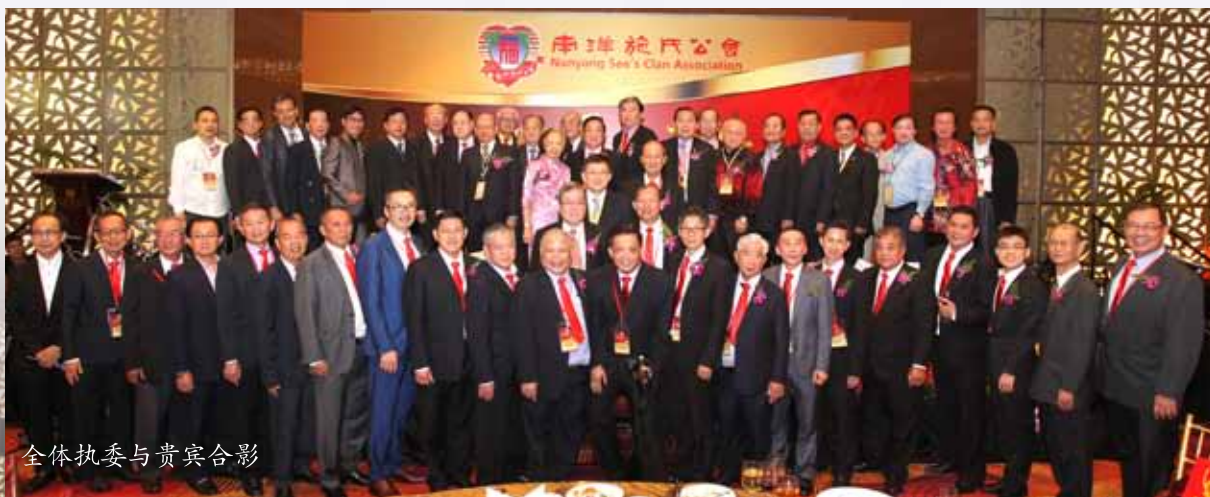
全体执委与贵宾合影