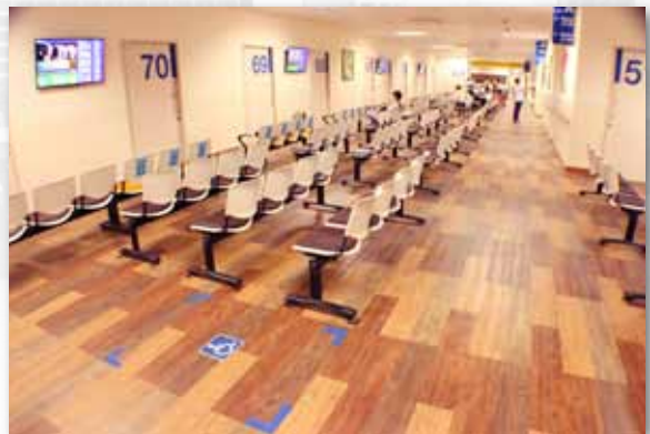
义顺综合诊所地板项目

做好了一个品牌，借助品牌给企业带来的美好印象，向下延伸产品，是品牌带来的附加值。SEE CONSTRUCTION & TRADING 立足于继续维护和巩固自己的品牌地位，立足于消费者而不是立足于企业自身来树立品牌形象。它不仅拥有自己的品牌产品，还拥有一支技术精湛的施工团队；不仅有学校的地板翻新项目，还承接过很多大项目工程，也包括和生意伙伴合作的项目。譬如，2006 年 REPUBLIC POLY 的地板工程、廉价航空机场的地板工程，2008 年仁慈社区医院的地板项目工程以及 2010 年义顺的邱德拔医院地板项目工程的施工、地板的供应等。之所以拿下这些大的工程项目，是因为 SEE CONSTRUCTION & TRADING 信用好、效率高，工人技术精湛及定时交货等。一间间大型项目工程的竣工，也为 SEE CONSTRUCTION & TRADING 巩固了自己的品牌地位。