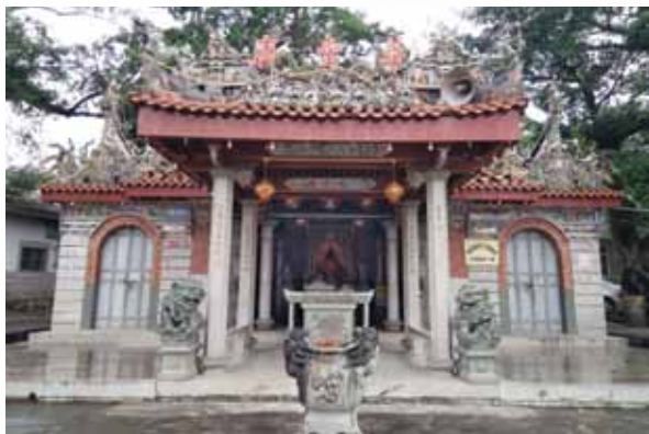
中国安溪县龙门山美华堂府全景

期，无一族人及村民受到损伤。神恩浩大，大家感应祖叔公保佑之力，日本投降后，先辈在神庙两侧加盖两座神殿，并建戏台。每年神诞，则演大戏庆祝，更是热闹，前来行香叩拜各