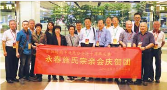
永春施氏宗亲会庆贺团