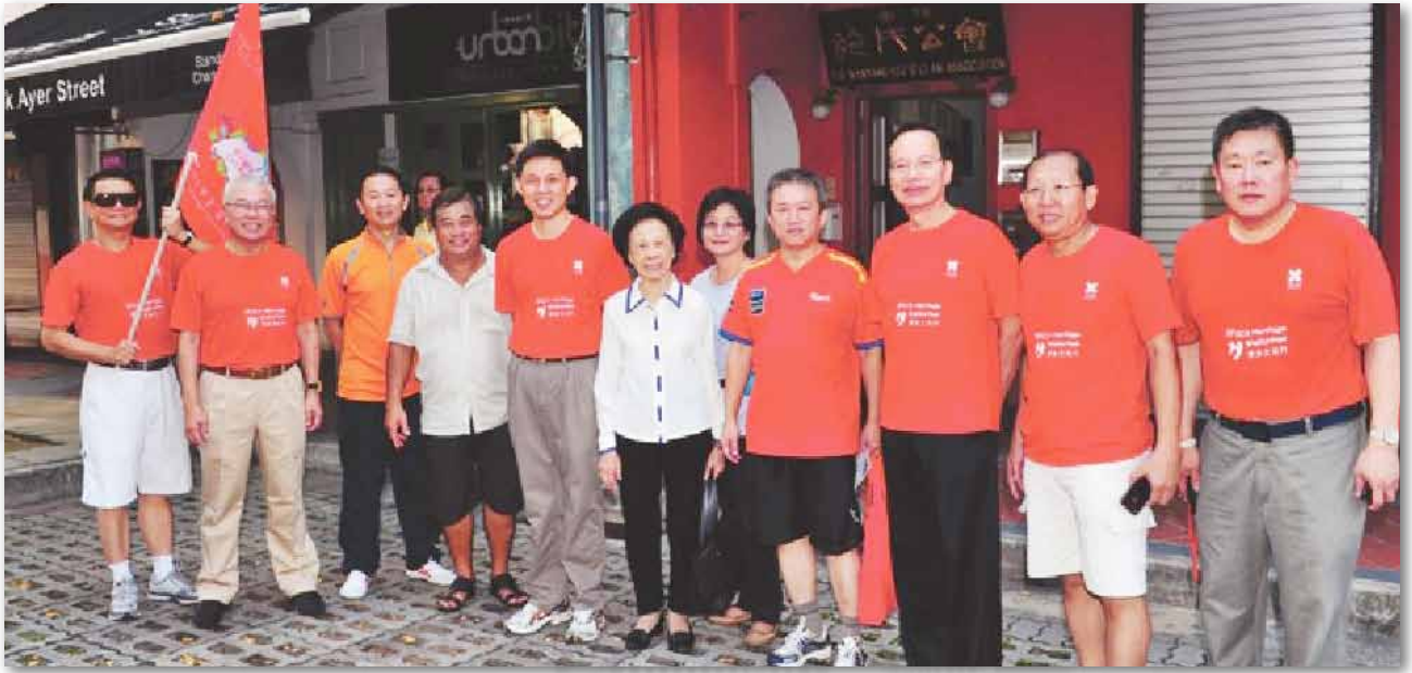
本会代表与新加坡总理公署部长陈振声先生（左五），宗乡会馆会长蔡天宝（左二）合影留念