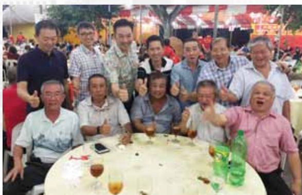
每年本会会员都参加聚圣庙活动，图为出席聚圣庙庆中元节晚宴照片

虽然从组织机构层面上看，南洋施氏公会与华堂府没有直接的联系。但是从会员个人层面看，施氏公会与华堂府之间存在一定关系。经统计，目前有近二十位施氏宗亲同时是聚圣庙华堂府及南洋施氏公会的执委或会员。如今，许多安溪围内的施氏宗亲成为南洋施氏公会执委与会员，共同为新加坡施氏宗亲的发展，团结一致发扬施氏族人的精神，共同努力为新加坡施氏宗亲的发展及未来鸿图贡献力量。