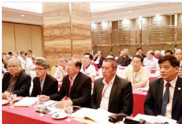
参加世界临濮施氏宗亲总会第16届会员代表大会一瞥