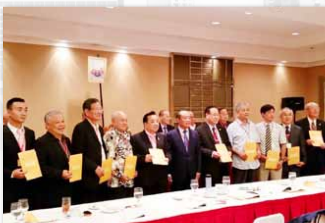
各地区施氏代表合影