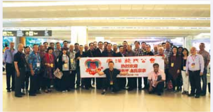
菲律宾施氏宗亲庆贺团