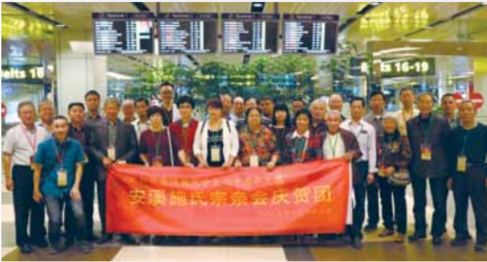
安溪施氏宗亲会庆贺团