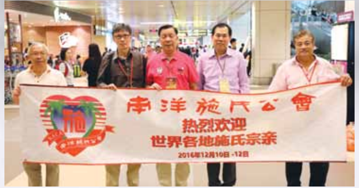
福建临澳施氏宗亲总会庆贺团