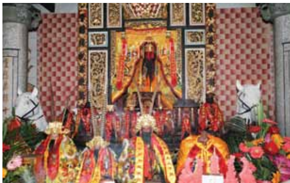
安溪山美村华堂府内堂

糕点，清茶美酒，丰盛五牲醴品坛前敬拜。道士在喧天锣鼓声中朗诵读经文做法事祝神诞，信仰者齐集一堂，场面热闹非凡。