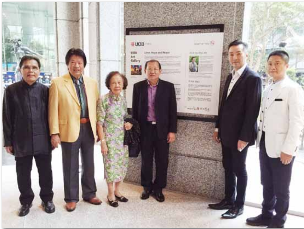
本会宗亲与施哲三博士（左二）合影

专注于油画和雕塑的国际艺术家施哲三博士，受邀于2016年4月4日至26日在大华银行的艺术馆（UOB Art Gallery）举行个人画展。《爱，希望与和平》为画展的精神主轴，由四川豆花饭庄与台湾的阳明春天蔬食参观携手呈现。期间，艺术馆展出了施哲三博士许多经典代表作。其