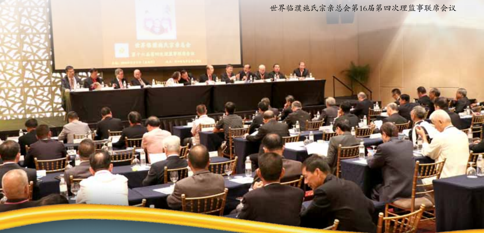
世界临濮施氏宗亲总会第16届第四次理监事联席会议